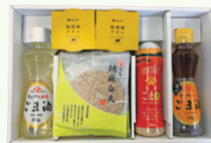
100株以上保有株主様への贈呈品例