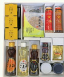
1,000株以上保有株主様への贈呈品例